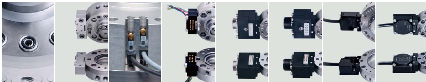
气压接头 单向阀型