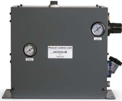
控制单元 model HCD□H-W

具有油压夹紧器必备的无泄漏功能（泄油量为零）的无泄漏阀与帕斯卡泵组成的气压驱动、手动操作的油压控制单元。两个油压回路可交替操作控制，最适合作为双动夹紧器的油压源。帕斯卡泵在回路油压上升后停止在平衡状态下，以保持油压。另外，液压油几乎没有温度变化，无需补压器。