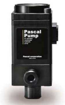
パスカルポンプ model X63