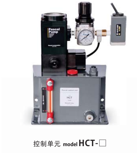
控制单元 model HCT-□