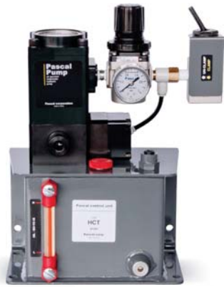
控制单元 model HCT-□